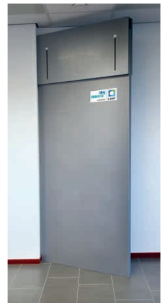
"G", "H", "I" en "J"-Elemente in mehreren Breiten lieferbar: 20, 30, 40 und 50 cm.