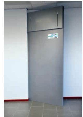
6310.0002 3 x "A" Standardelemente