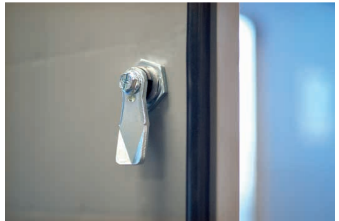
Q-BENG-Türen können von innen und außen abgeschlossen werden.