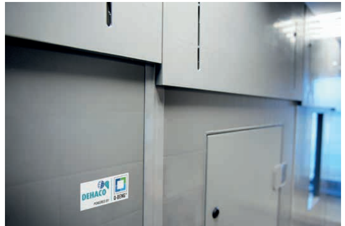
Q-BENG-Elemente können in der Höhe bis 270 cm verstellt werden.