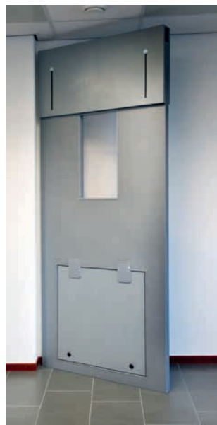
6310.0006 "E"-Element mit Luke und Fenster.