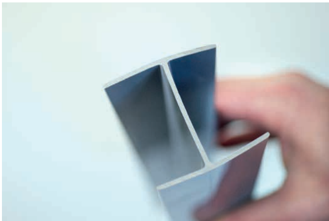
6325.0001 - 7 x H-Profile.