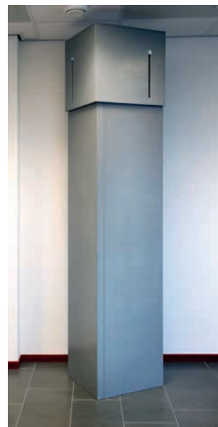
6310.0007 "F"-Element Winkel 45 x 50 cm.