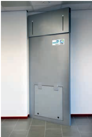
6310.0005 1 x "D"-Element mit Luke für ODM.