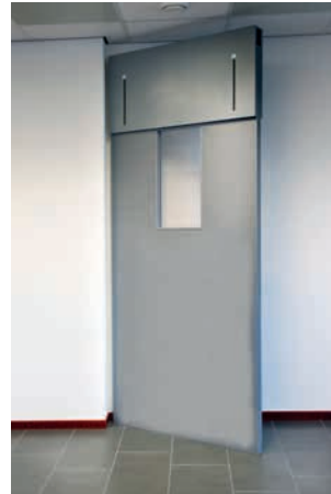
6310.0003 2 x "B"-Fensterelemente.