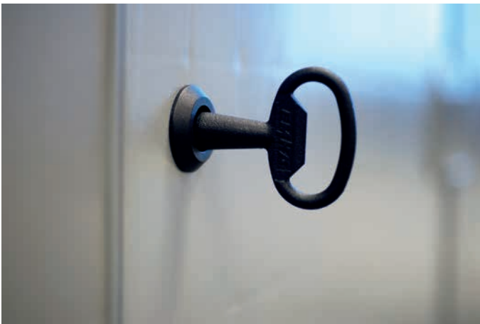
Q-BENG-Türen können von innen und außen abgeschlossen werden.