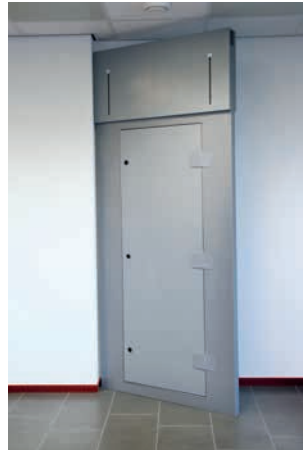
6310.0004 2 x "C"-Türelemente.